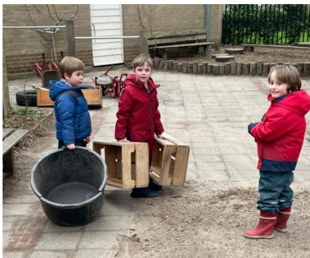
Een volleerde bouwvakker die kisten en planken aan het versjouden is voor de bouw van een hut