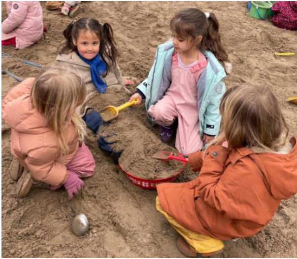
Een Ingegraven kleuter (zij is later wel weer opgegraven) en lekker prutten met water