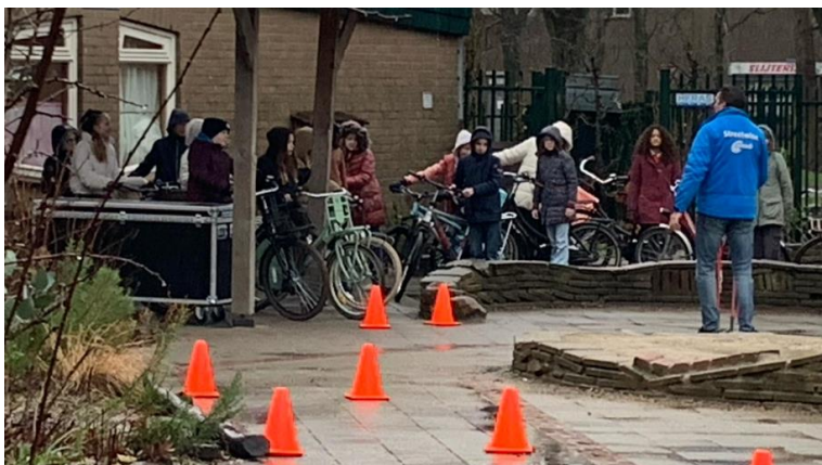
Behendigheidsparcour op het schoolplein