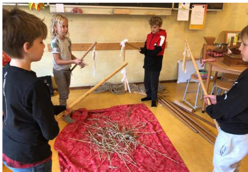
De dors-vlegels samen op maat slaan op het graan